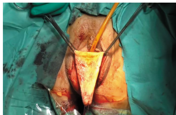
Fig. 1. Deepithelialized vascularized flap of the posterior vaginal wall.