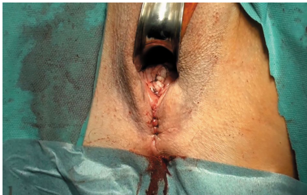
Рис. 3. Влагалищный лоскут фиксируется к передней продольной связке позвоночника на уровне мыса крестца.